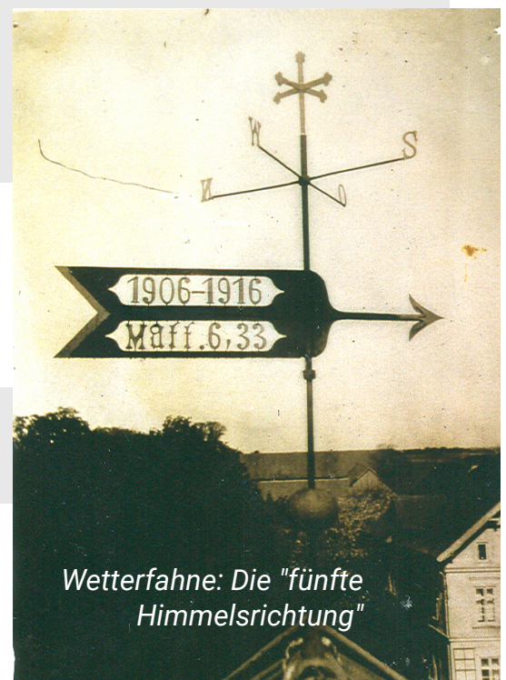
Wetterfahne: Die "fünfte Himmelsrichtung"

A: König Saul B: König David C: König Salomo