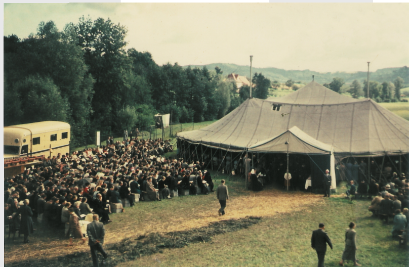
50 Jahre zuvor: Konferenz 1956 beim 50-jährigen Jubiläum

Explorative Jugendarbeit, Griechisch, Kochen, Ethik, Sport, Klettern, Dogmatik, Musik, Künstlerisches Gestalten