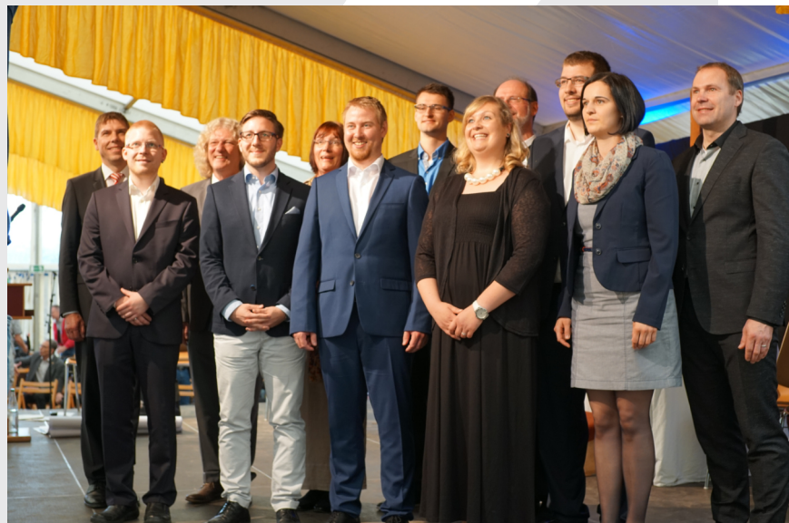
Der Ordinationsjahrgang 2016